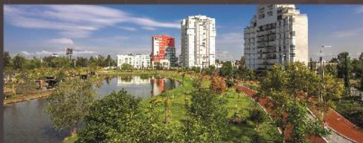
Parque del Arte